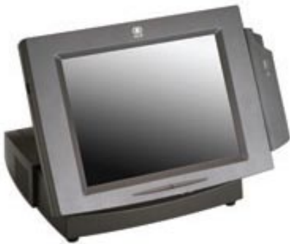
PC med touchscreen

Duett Kasse består av en PC med touchscreen skjerm. Riktig vare, antall mv. hentes opp ved å trykke direkte på skjermen. Til PC'en kan det kobles en strekkode-leser, kasseskuff, kvitteringsskriver og et kundedisplay. Kassessystemet produserer bl.a. kontantnotaer, kvitteringsstrimmel og dagsoppgjør. Både oppgjør i kontanter og med betalingskort er mulig. Kasse kjøres sammen med fakturamodulen, slik at du velger kontant eller kredittsalg etter behov.